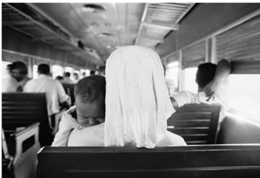
Tren baiano , Fotografía de Claudia Andujar , de la serie Historias reales (1969). Impresión con tinta pigmentada mineral sobre papel de algodón, 73 x 110 cm.

* Psicoanalista, Miembro de la Asociación Psicoanalítica de Uruguay (APU), Editora de Calibán – Revista Latinoamericana de Psicoanálisis